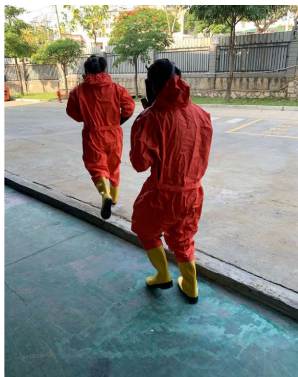
跑步前往事故现场