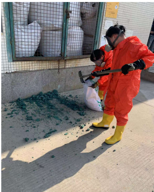
利用编织袋铁铲装泄露污泥