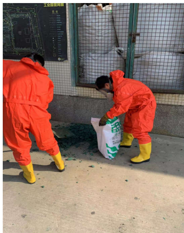
利用编织袋铁铲装泄露污泥