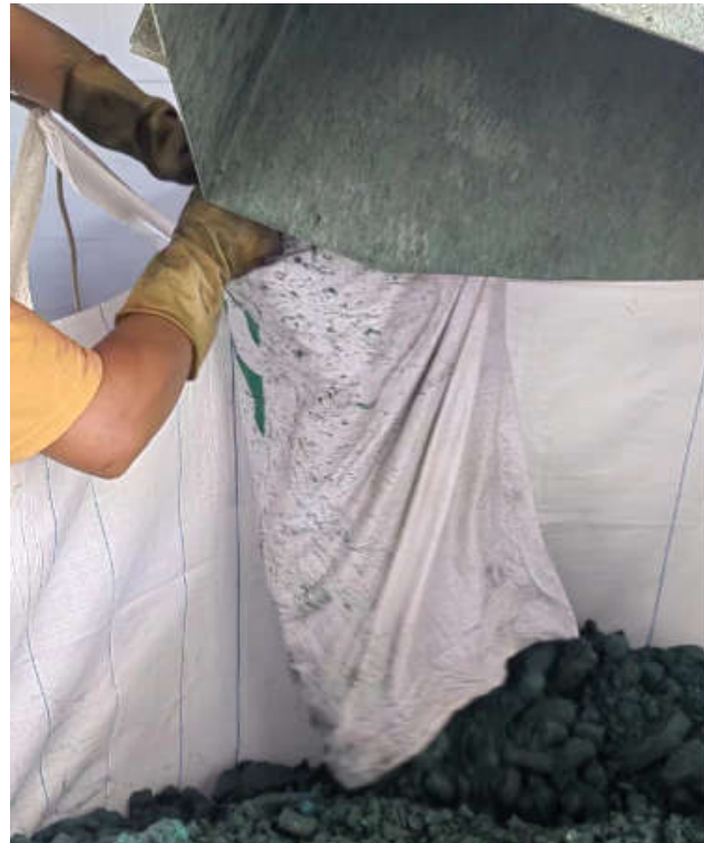
泄露污泥收集倒入污泥袋