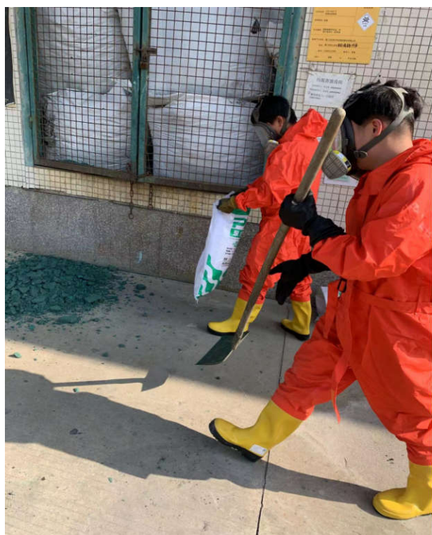
利用编织袋铁铲装泄露污泥