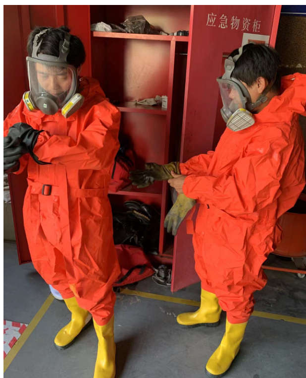
应急小组成员穿戴防护品